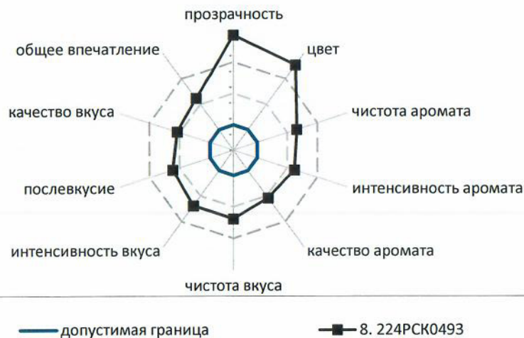
Рис.2.2. Сравнение качества образцов вина тихого (дегустация 22.09.2021 сет 2)

Протокол не может быть воспроизведен полностью или частично без письменного разрешения Руководителя Сенсорной лаборатории.