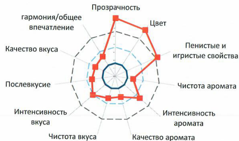
Рис. 1.2. Сравнение качества образцов вина игристого (дегустация 21.09.2021 сет 1)