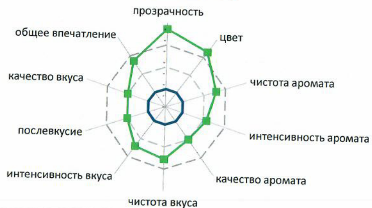
Рис.1.1. Сравнение качества образцов вина тихого (дегустация 27.09.2021 сет 1)