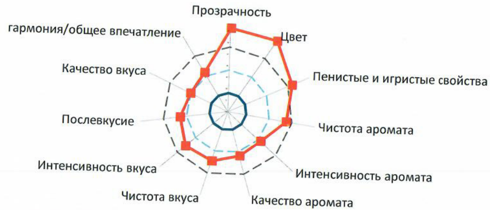
Рис. 2.3. Сравнение качества образцов вина игристого (дегустация 08.09.2021 2сет)