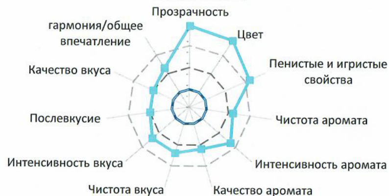
Рис.1.1. Сравнение качества образцов вина игристого (дегустация 20.09.2021 сет 1)