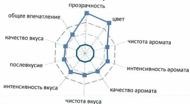
Рис.2.4. Сравнение качества образцов вина тихого (дегустация 10.09.2021 сет 2)