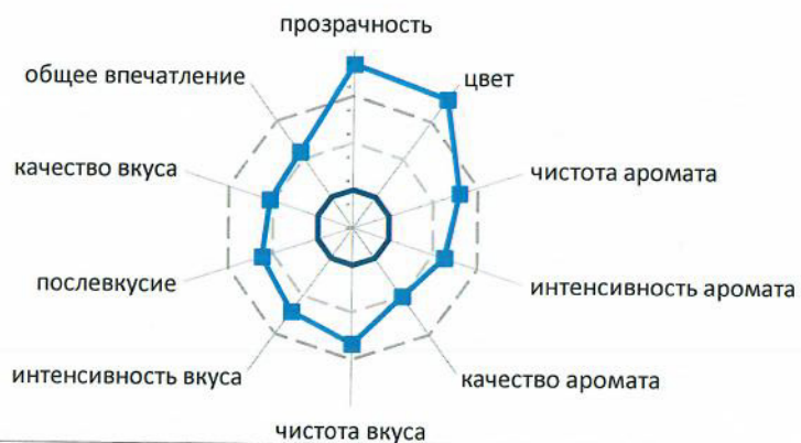
Рис.4.2. Сравнение качества образцов вина тихого (дегустация 23.09.2021 сет 4)