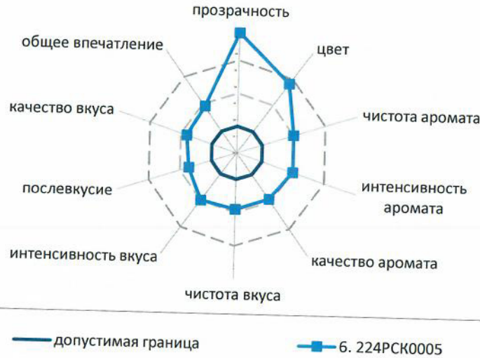
Рис.3.2. Сравнение качества образцов вина тихого (дегустация 07.09.2021 сет 3)

Протокол не может быть воспроизведен полностью или частично без письменного разрешения Руководителя Сенсорной лаборатории. Полученные результаты относятся к предоставленным Заказчиком образцам. Конец выписки из протокола