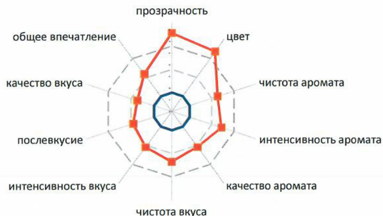
Рис.2.1. Сравнение качества образцов вина тихого (дегустация 24.09.2021 сет 2)