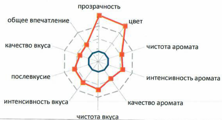
Рис.4.2. Сравнение качества образцов вина тихого (дегустиация 21.09.2021 сет 4)