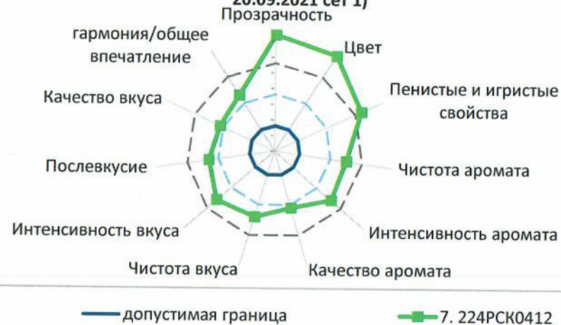
Рис. 1.2. Сравнение качества образцов вина игристого (дегу-стация 20.09.2021 сет 1)

Протокол не может быть воспроизведен полностью или частично без письменного разрешения Руководителя Сенсорной лаборатории. Полученные результаты относятся к предоставленным Заказчиком образцам. Конец выписки из протокола.