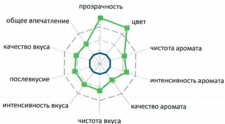
Рис.2.1. Сравнение качества образцов вина тихого (дегустация 16.09.2021 сет 2)