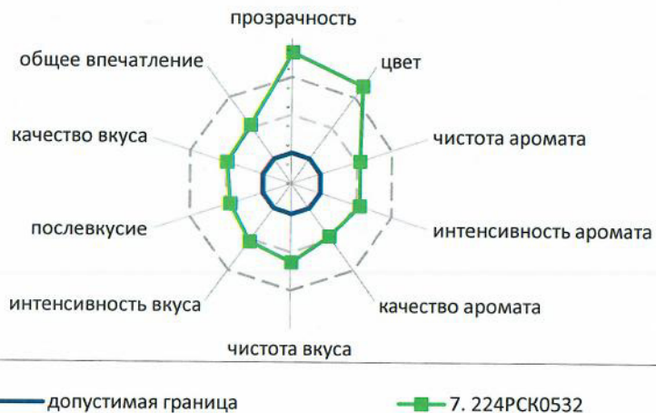
Рис.3.2. Сравнение качества образцов вина тихого (дегустация 23.09.2021 сет 3)

Протокол не может быть воспроизведен полностью или частично без письменного разрешения Руководителя Сенсорной лаборатории. Полученные результаты относятся к предоставленным Заказчиком образцам. Конец выписки из протокола.