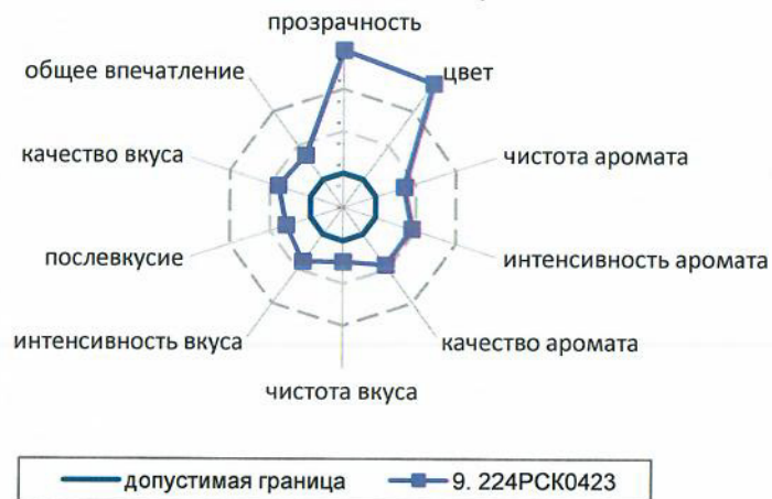
Рис.3.3. Сравнение качества образцов вина тихого (дегустация 20.09.2021 сет 3)

Протокол не может быть воспроизведен полностью или частично без письменного разрешения Руководителя Сенсорной лаборатории.