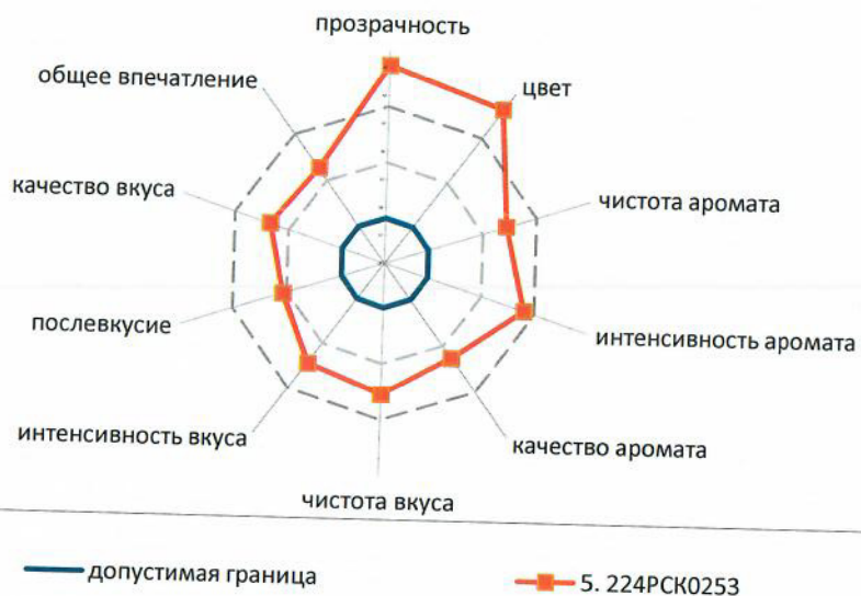
Рис.2.2. Сравнение качества образцов вина тихого (дегустация 14.09.2021 сет 2)

Протокол не может быть воспроизведен полностью или частично без письменного разрешения Руководителя Сенсорной лаборатории. Полученные результаты относятся к предоставленным Заказчиком образцам.