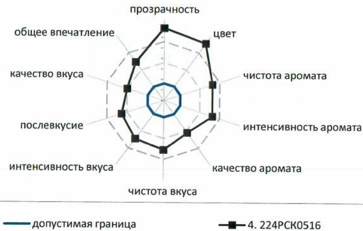
Рис.4.1. Сравнение качества образцов вина тихого (дегустиация 23.09.2021 сет 4)

Протокол не может быть воспроизведен полностью или частично без письменного разрешения Руководителя Сенсорной лаборатории. Полученные результаты относятся к предоставленным Заказчиком образцам. Конец выписки из протокола.