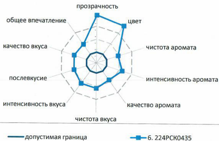
Рис.2.2. Сравнение качества образцов вина тихого (дегустиция 21.09.2021 сет 2)

Протокол не может быть воспроизведен полностью или частично без письменного разрешения Руководителя Сенсорной лаборатории.