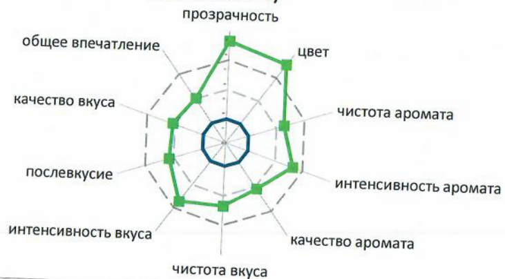
Рис.2.4. Сравнение качества образцов вина тихого (дегустация 10.09.2021 сет 2)