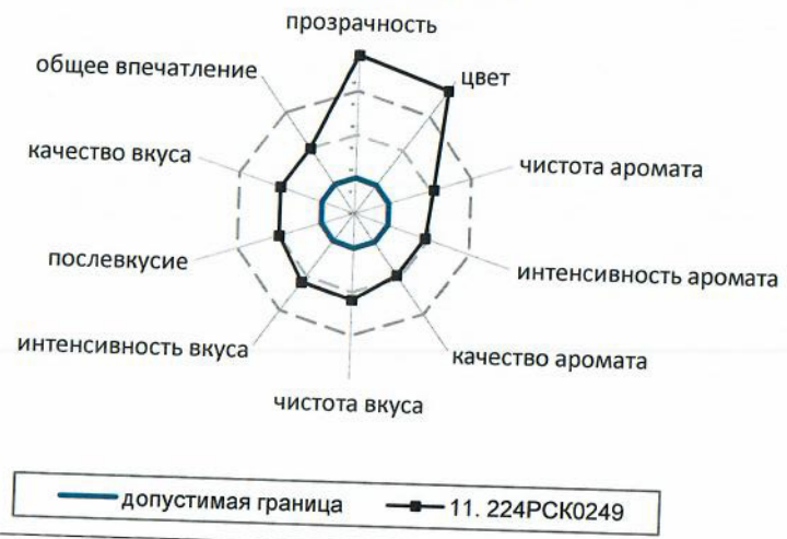
Рис.4.3. Сравнение качества образцов вина тихого (дегустация 14.09.2021 сет 4)

Протокол не может быть воспроизведен полностью или частично без письменного разрешения Руководителя Сенсорной лаборатории. Полученные результаты относятся к предоставленным Заказчиком образцам. Конец выписки из протокола.