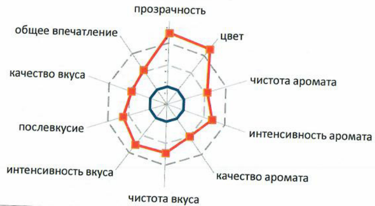
Рис.4.1. Сравнение качества образцов вина тихого (дегустация 24.09.2021 сет 4)