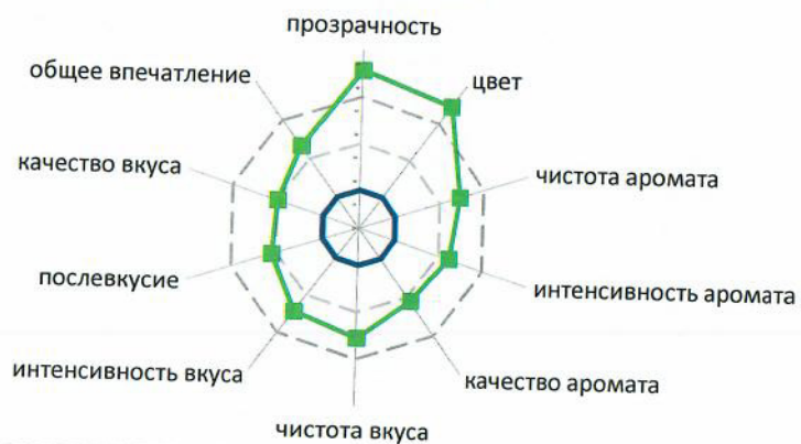
Рис.4.1. Сравнение качества образцов вина тихого (дегустация 24.09.2021 сет 4)