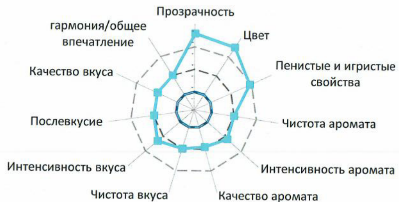
Рис.1.1. Сравнение качества образцов вина игристого (дегустация 16.09.2021 сет 1)