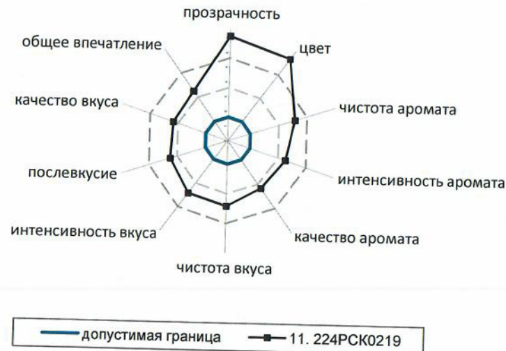
Рис.1.3. Сравнение качества образцов вина тихого (дегустация 14.09.2021 сет 1)

Протокол не может быть воспроизведен полностью или частично без письменного разрешения Руководителя Сенсорной лаборатории. Полученные результаты относятся к предоставленным Заказчиком образцам. Конец выписки из протокола.