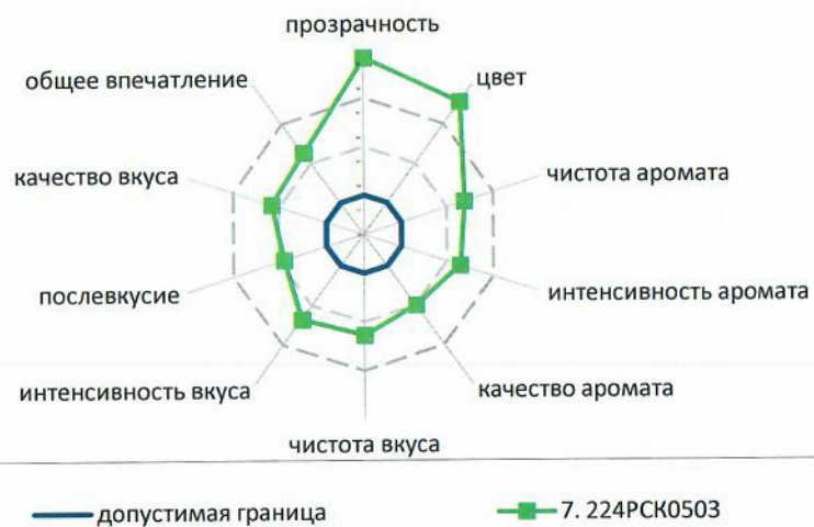
Рис.2.2. Сравнение качества образцов вина тихого (дегустация 22.09.2021 сет 2)

Протокол не может быть воспроизведен полностью или частично без письменного разрешения Руководителя Сенсорной лаборатории.