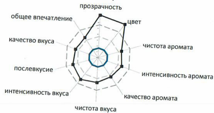
Рис.4.3. Сравнение качества образцов вина тихого (дегустация 08.09.2021 сет 4)