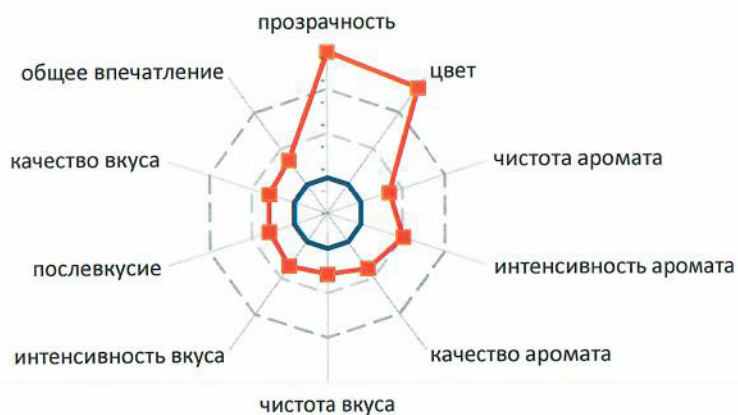
Рис.2.1. Сравнение качества образцов вина тихого (дегустиация 22.09.2021 сет 2)