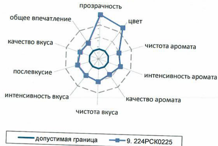
Рис.4.3. Сравнение качества образцов вина тихого (дегустиация 14.09.2021 сет 4)

Протокол не может быть воспроизведен полностью или частично без письменного разрешения Руководителя Сенсорной лаборатории. Полученные результаты относятся к предоставленным Заказчиком образцам. Конец выписки из протокола.