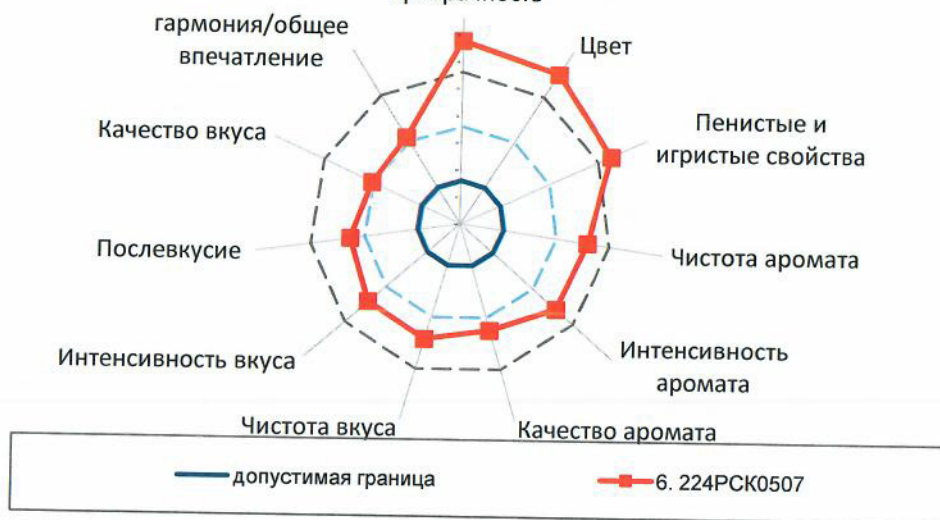
Рис. 1.2. Сравнение качества образцов вина игристого (дегустация 23.09.2021 сет 1)

Протокол не может быть воспроизведен полностью или частично без письменного разрешения Руководителя Сенсорной лаборатории. Полученные результаты относятся к предоставленным Заказчиком образцам.