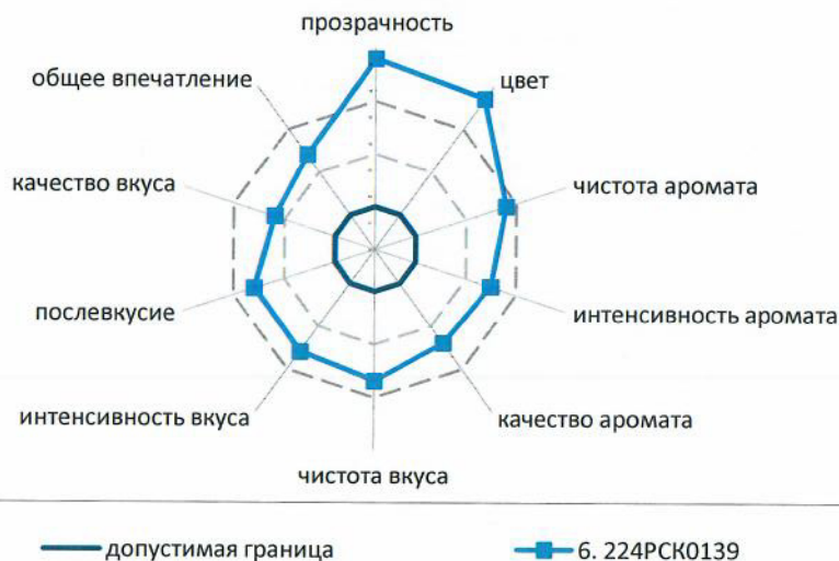
Рис.3.2. Сравнение качества образцов вина тихого (дегустация 10.09.2021 сет 3)

Протокол не может быть воспроизведен полностью или частично без письменного разрешения Руководителя Сенсорной лаборатории.