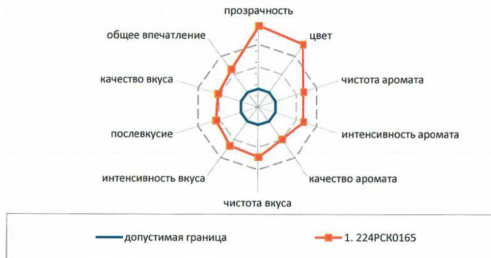
Рис.3.1. Сравнение качества образцов вина тихого (дегустация 10.09.2021 сет 3)

Протокол не может быть воспроизведен полностью или частично без письменного разрешения Руководителя Сенсорной лаборатории. Полученные результаты относятся к предоставленным Заказчиком образцам. Конец выписки из протокола.