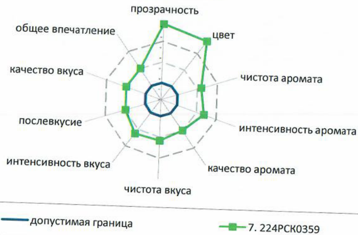
Рис.2.2. Сравнение качества образцов вина тихого (дегустация 17.09.2021 сет 2)

Протокол не может быть воспроизведен полностью или частично без письменного разрешения Руководителя Сенсорной лаборатории. Полученные результаты относятся к предоставленным Заказчиком образцам. Конец выписки из протокола.