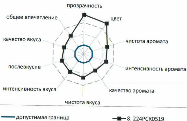
Рис.2.2. Сравнение качества образцов вина тихого (дегустация 23.09.2021 сет 2)

Протокол не может быть воспроизведен полностью или частично без письменного разрешения Руководителя Сенсорной лаборатории.