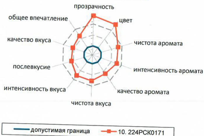
Рис.3.3. Сравнение качества образцов вина тихого (дегустиация 13.09.2021 сет 3)

Протокол не может быть воспроизведен полностью или частично без письменного разрешения Руководителя Сенсорной лаборатории. Полученные результаты относятся к предоставленным Заказчиком образцам. Конец выписки из протокола.