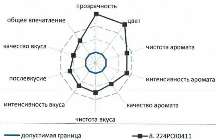
Рис.3.2. Сравнение качества образцов вина тихого (дегустация 20.09.2021 сет 3)

Протокол не может быть воспроизведен полностью или частично без письменного разрешения Руководителя Сенсорной лаборатории.