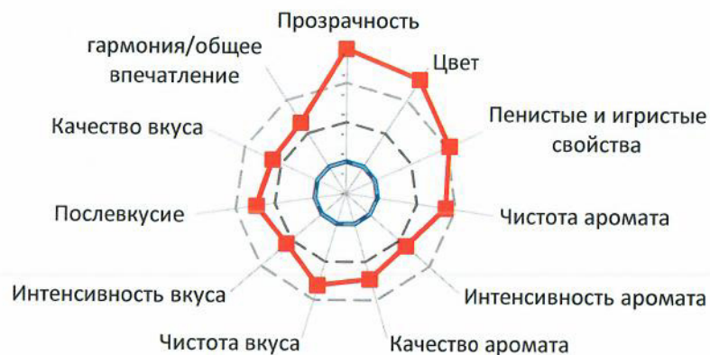
Рис.1.1. Сравнение качества образцов вина игристого (дегустация 21.09.2021 сет 1)