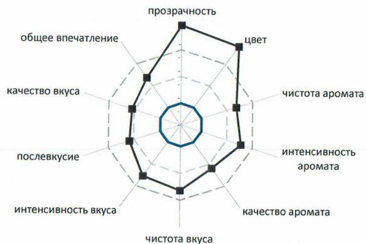
Рис.4.1. Сравнение качества образцов вина тихого (дегустиция 20.09.2021 сет 4)