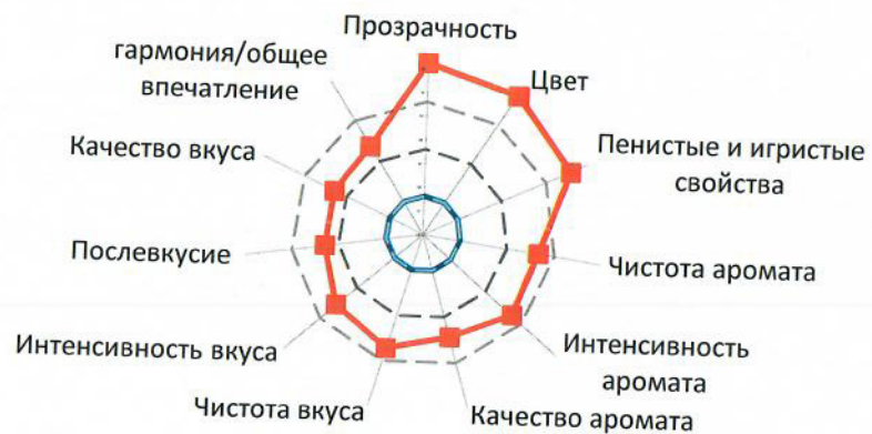
Рис.1.1. Сравнение качества образцов вина игристого (дегустиция 13.09.2021 сет 2)