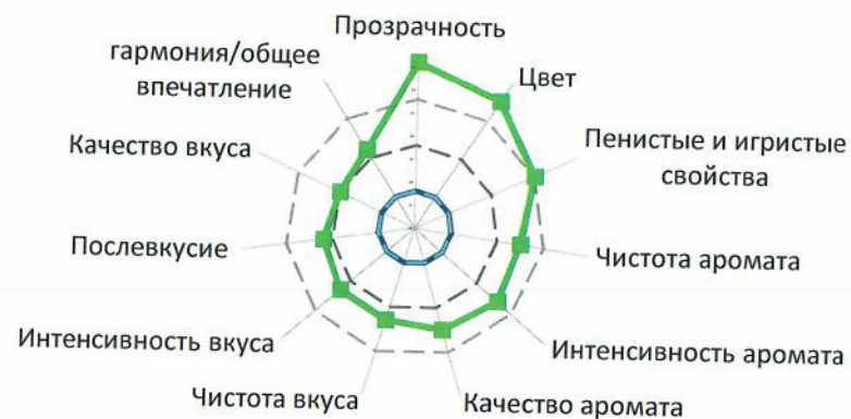
Рис.2.1. Сравнение качества образцов вина игристого (дегустация 07.09.2021 2 сет)