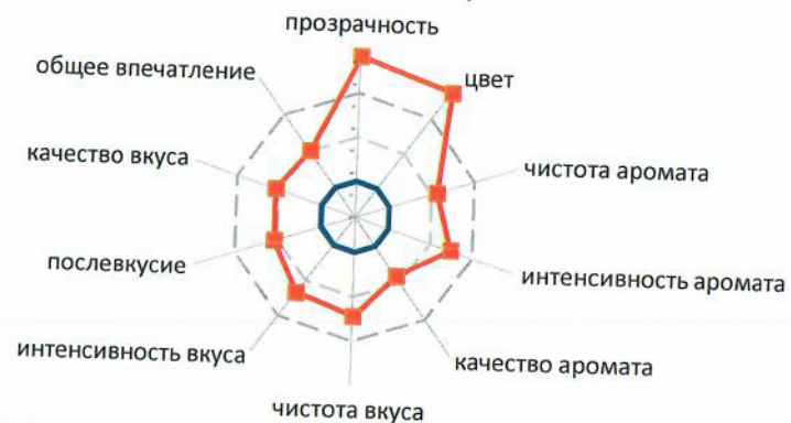
Рис.4.1. Сравнение качества образцов вина тихого (дегустация 17.09.2021 сет 4)