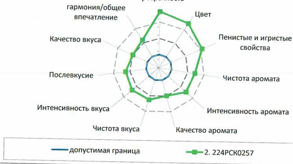
Рис.1.1. Сравнение качества образцов вина игристого (дегустация 15.09.2021 сет 1) Прозрачность

Протокол не может быть воспроизведен полностью или частично без письменного разрешения Руководителя Сенсорной лаборатории. Полученные результаты относятся к предоставленным Заказчиком образцам. Конец выписки из протокола.