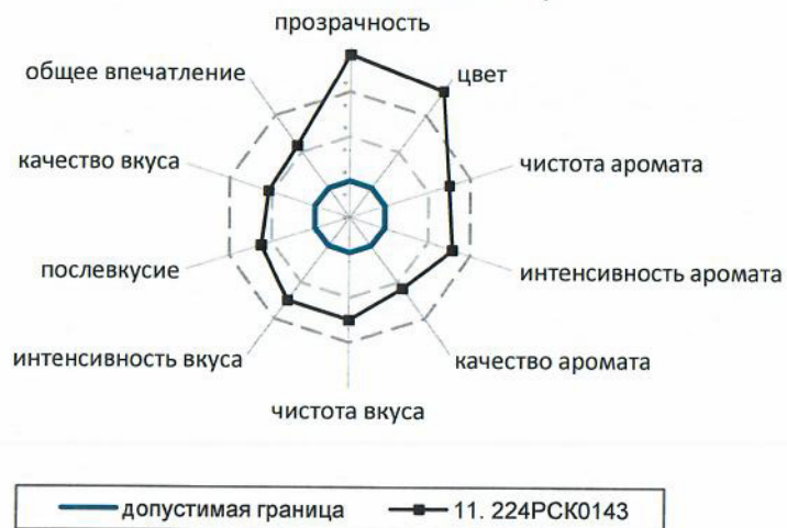
Рис.3.3. Сравнение качества образцов вина тихого (дегустация 10.09.2021 сет 3)

Протокол не может быть воспроизведен полностью или частично без письменного разрешения Руководителя Сенсорной лаборатории.