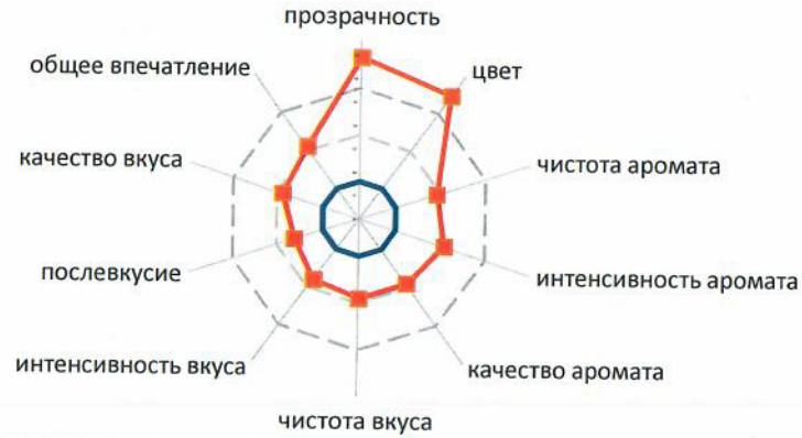
Рис.2.1. Сравнение качества образцов вина тихого (дегустиация 23.09.2021 сет 2)