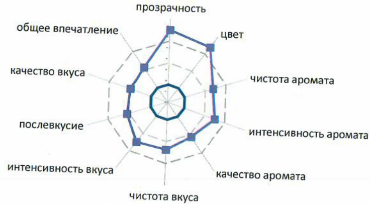
Рис.2.3. Сравнение качества образцов вина тихого (дегустация 24.09.2021 сет 2)