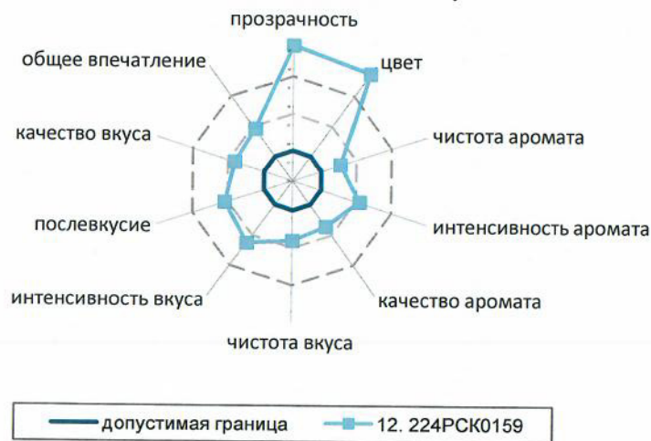
Рис.3.3. Сравнение качества образцов вина тихого (дегустиация 10.09.2021 сет 3)

Протокол не может быть воспроизведен полностью или частично без письменного разрешения Руководителя Сенсорной лаборатории.