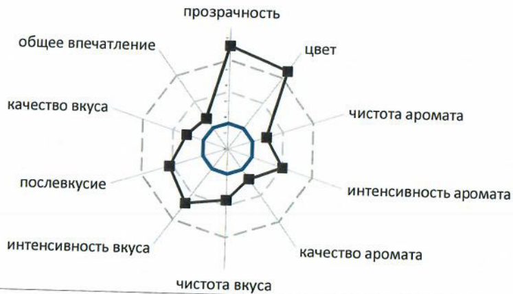
Рис.2.2. Сравнение качества образцов вина тихого (дегустиация 24.09.2021 сет 2)