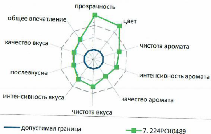
Рис.3.2. Сравнение качества образцов вина тихого (дегустация 22.09.2021 сет 3)

Протокол не может быть воспроизведен полностью или частично без письменного разрешения Руководителя Сенсорной лаборатории. Полученные результаты относятся к предоставленным Заказчиком образцам. Конец выписки из протокола.