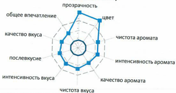
Рис.3.1. Сравнение качества образцов вина тихого (дегустиция 17.09.2021 сет 3)