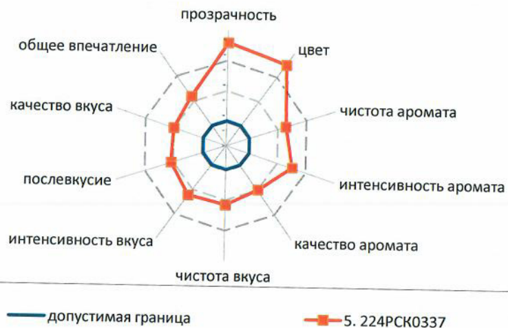
Рис.4.2. Сравнение качества образцов вина тихого (дегустация 16.09.2021 сет 4)

Протокол не может быть воспроизведен полностью или частично без письменного разрешения Руководителя Сенсорной лаборатории.