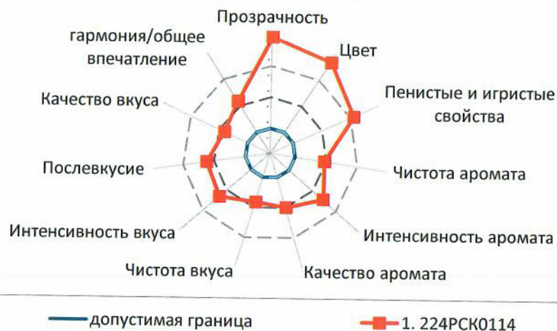
Рис.1.1. Сравнение качества образцов вина игристого (дегустация 09.09.2021 1 сет)

Протокол не может быть воспроизведен полностью или частично без письменного разрешения Руководителя Сенсорной лаборатории. Полученные результаты относятся к предоставленным Заказчиком образцам. Конец выписки из протокола