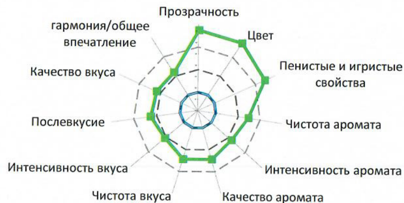
Рис.1.1. Сравнение качества образцов вина игристого (дегустация 13.09.2021 1 сет)